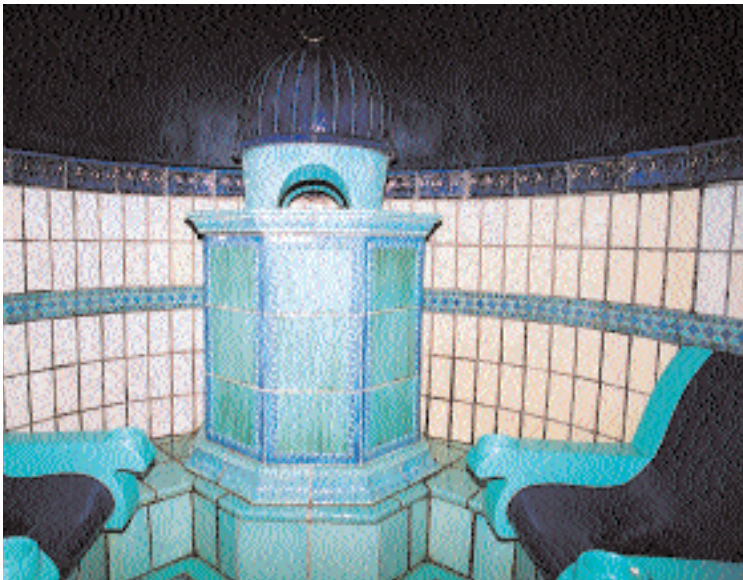
Verwöhnen lassen können sich Hotelgäste auch im Rasulbad, einer altägyptischen Heilerdebehandlung.