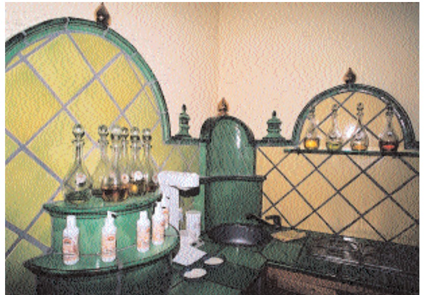
Das entspannte Einatmen ätherischer Öle ist im Wellnessprogramm des Schlosshotels Weyberhöfe inbegriffen.

Fitnessraum an Kraft- und Ausdauergeräten hinter sich oder bereitet sich auf einen Gang in eine der beiden Saunen vor. Die Auswahl besteht zwischen einer klassischen finnischen Sauna mit Temperaturen von 90 bis 100 ° C und einem Steindampfbad (ca. 60 ° C), wo heiße Steine in mit ätherischen Ölen versetztes Wasser getaucht werden.